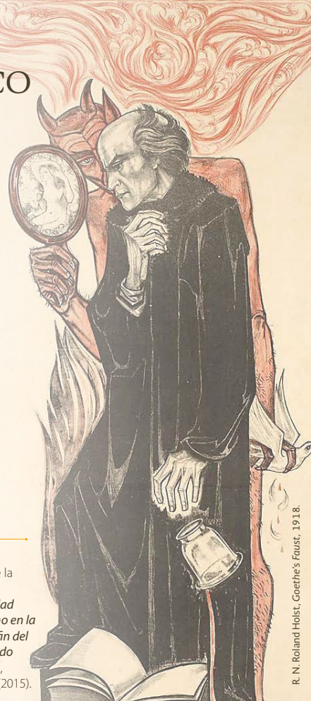
R. N. Roland Holst, Goethe's Faust, 1918.